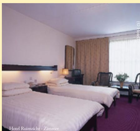
Hotel Ruimzicht - Zimmer

Deutsche Staatsangehörige benötigen einen gültigen Personalausweis. Bürger anderer Nationalitäten informieren sich bitte bei den zuständigen staatlichen Stellen.