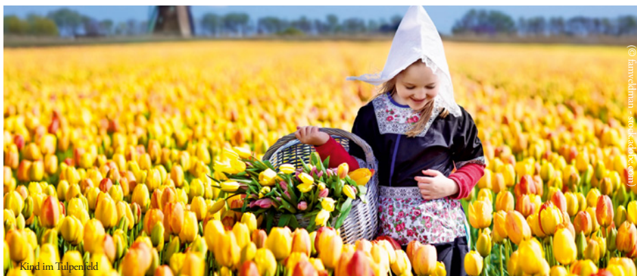
Kind im Tulpenfeld