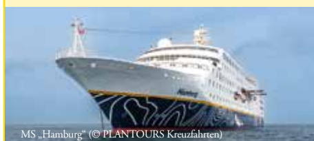
MS „Hamburg“

** Die genaue Kabinennummer erhalten Sie mit den Reiseunterlagen.