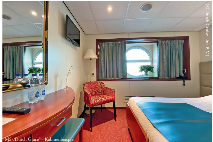
MS „Dutch Grace“ - Kabinenbeispiel