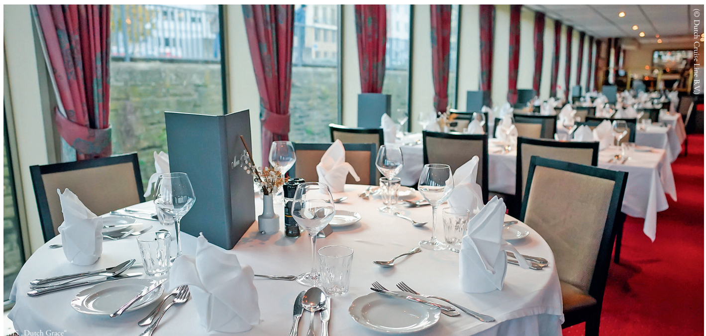
MS „Dutch Grace“