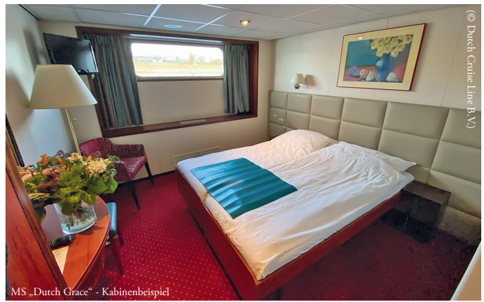
MS „Dutch Grace“ - Kabinenbeispiel

Bei gutem Wetter können Sie es sich auf dem Sonnendeck gemütlich machen. Dort stehen Ihnen eine Bar, Liegestühle, ein Schachspiel und ein kleiner Whirlpool zur Verfügung. Mit dem Lift können das Haupt-, die Mitteldeck Superior Kabinen und das Oberdeck erreicht werden. WLAN (Verbindungsgeschwindigkeit kann variieren) steht Ihnen gegen Gebühr zur Verfügung. Tagsüber eignet sich legere Kleidung, zum Abendessen und zu besonderen Anlässen erwartet man Sie elegant gekleidet.