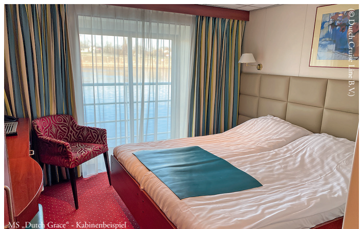
MS „Dutch Grace“ - Kabinenbeispiel