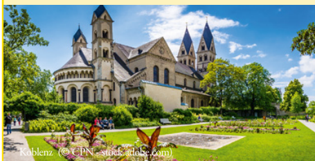
Koblenz (© CPN - stock.adobe.com)