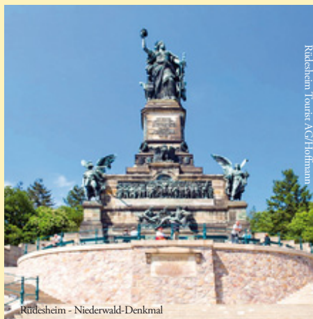
Rüdesheim - Niederwald-Denkmal

Mindestteilnehmerzahl: 100 Personen Deutsche Staatsangehörige benötigen einen gültigen Personalausweis. Bürger anderer Nationalitäten informieren sich bitte bei den zuständigen staatlichen Stellen.