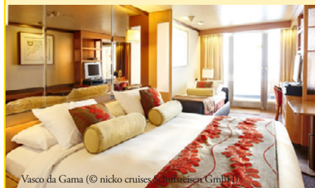
Vasco da Gama