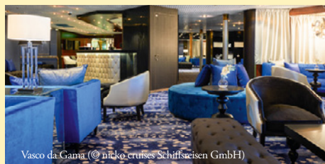
Vasco da Gama

Mindestteilnehmerzahl: 10 Personen Deutsche Staatsbürger benötigen einen gültigen Personalweis. Bürger anderer Nationalitäten informieren sich bitte bei den zuständigen staatlichen Stellen. Außerdem ist für die Reise eine Auslandskrankenversicherung zwingend erforderlich sowie zur Buchung die Angabe einer mobilen Rufnummer und eigenen E-Mail-Adresse .