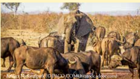
Kruger Nationalpark