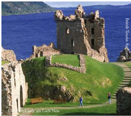
British Tourist Authority