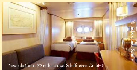
Vasco da Gama

Nicht im Reisepreis enthalten: - Trinkgelder: Wir empfehlen ein Trinkgeld in Höhe von 8,- EUR p. P./Tag. Den Gästen steht es frei, den Betrag zu erhöhen oder reduzieren zu lassen. - Ausflüge: Das ausführliche Landausflugsprogramm mit Preisangaben erhalten Sie mit den Reiseunterlagen. - alle nicht ausdrücklich genannten Leistungen Änderungen des Reiseverlaufs und des Ausflugsprogrammes bleiben vorbehalten! Transferfahrten zum/ab Hauptbus erfolgen im PKW, Kleinbus oder Reisebus. Die Abfahrtszeit erhalten Sie mit den Reiseunterlagen. Bitte denken Sie an einen ausreichenden Versicherungsschutz für Ihre Reise (siehe Seite 99). Bitte beachten Sie weitere Hinweise ab Seite 88 sowie die Schiffsbeschreibung auf den Seiten 64-65. Mindestteilnehmerzahl: 10 Personen Deutsche Staatsbürger benötigen einen gültigen Reisepass. Bürger anderer Nationalitäten informieren sich bitte bei den zuständigen staatlichen Stellen. Außerdem ist für die Reise eine Auslandskrankenversicherung zwingend erforderlich sowie zur Buchung die Angabe einer mobilen Rufnummer und eigenen E-Mail-Adresse .