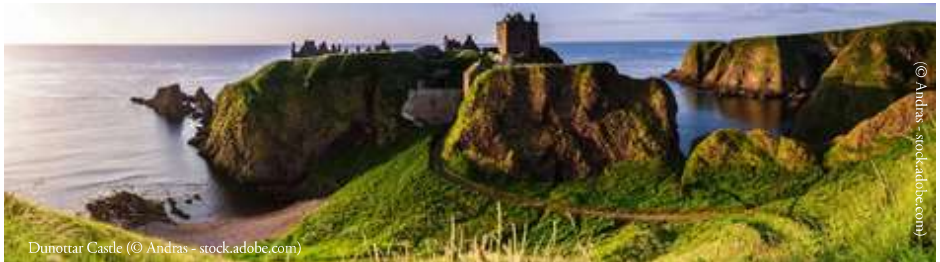
Dunnottar Castle