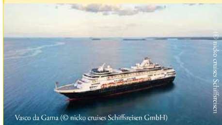
Vasco da Gama