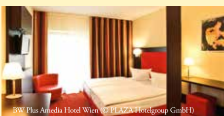
BW Plus Amedia Hotel Wien